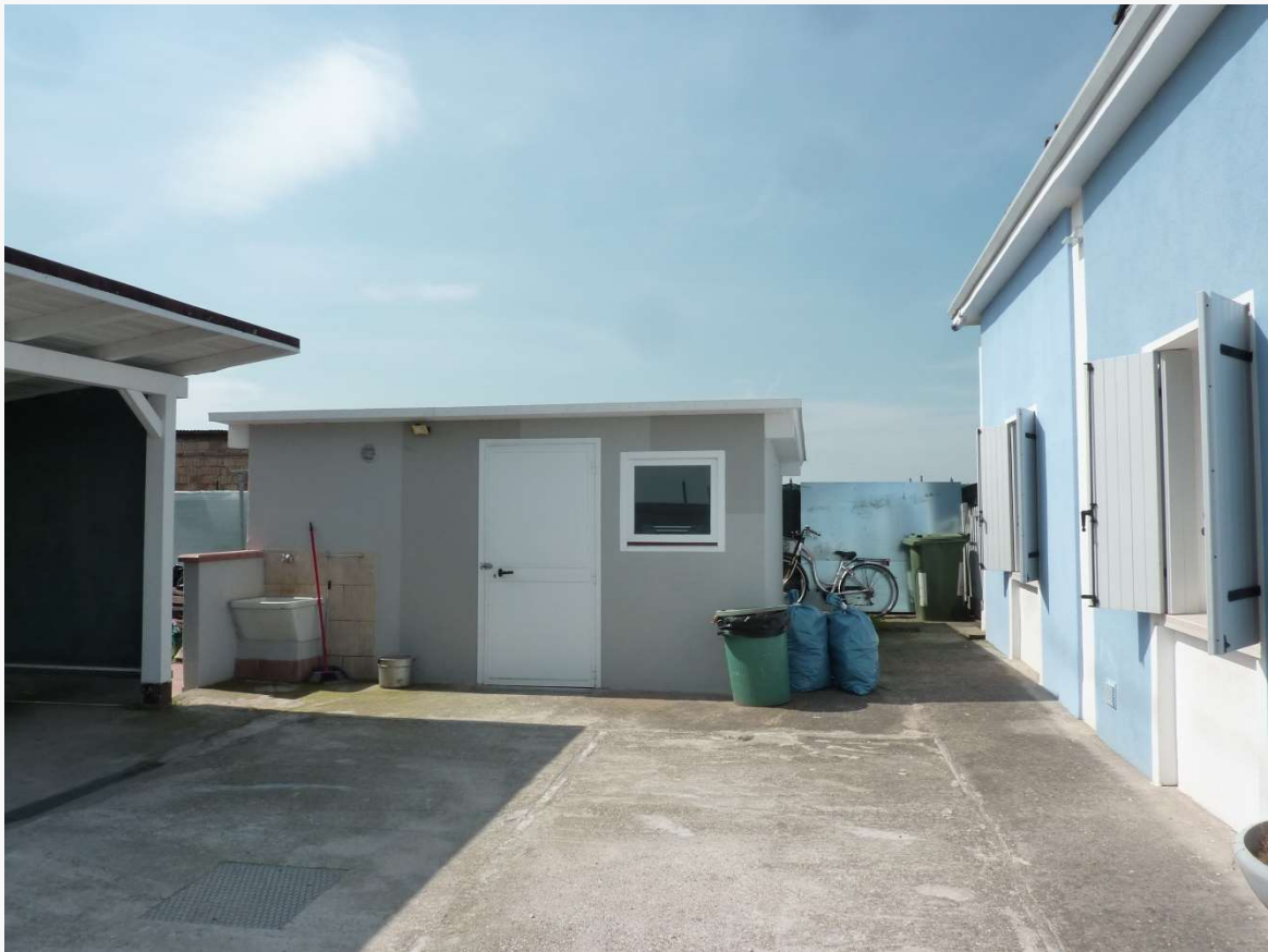
FOTO 17 _ VISTA DELL'AUTORIMESSA SUB 2 DALLA CORTE PERTINENZIALE