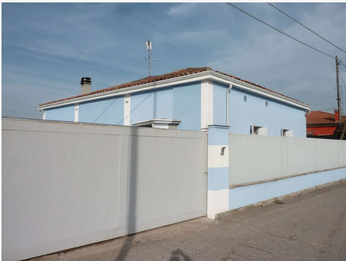
FOTO 3 _ VISTA ANGOLARE DEL COMPLESSO IMMOBILIARE DA VIA CODALUNGA – PROSPETTI SUD ED EST