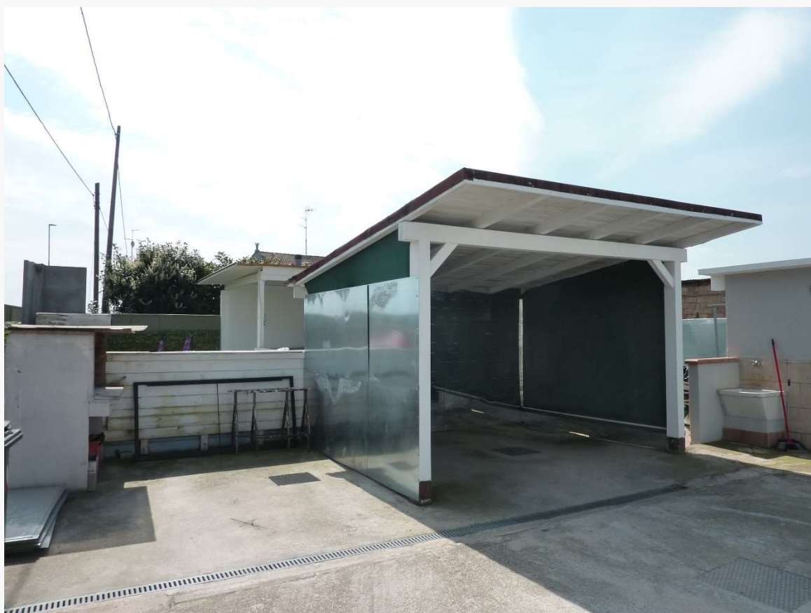
FOTO 14 _ VISTA DELLA CORTE PERTINENZIALE