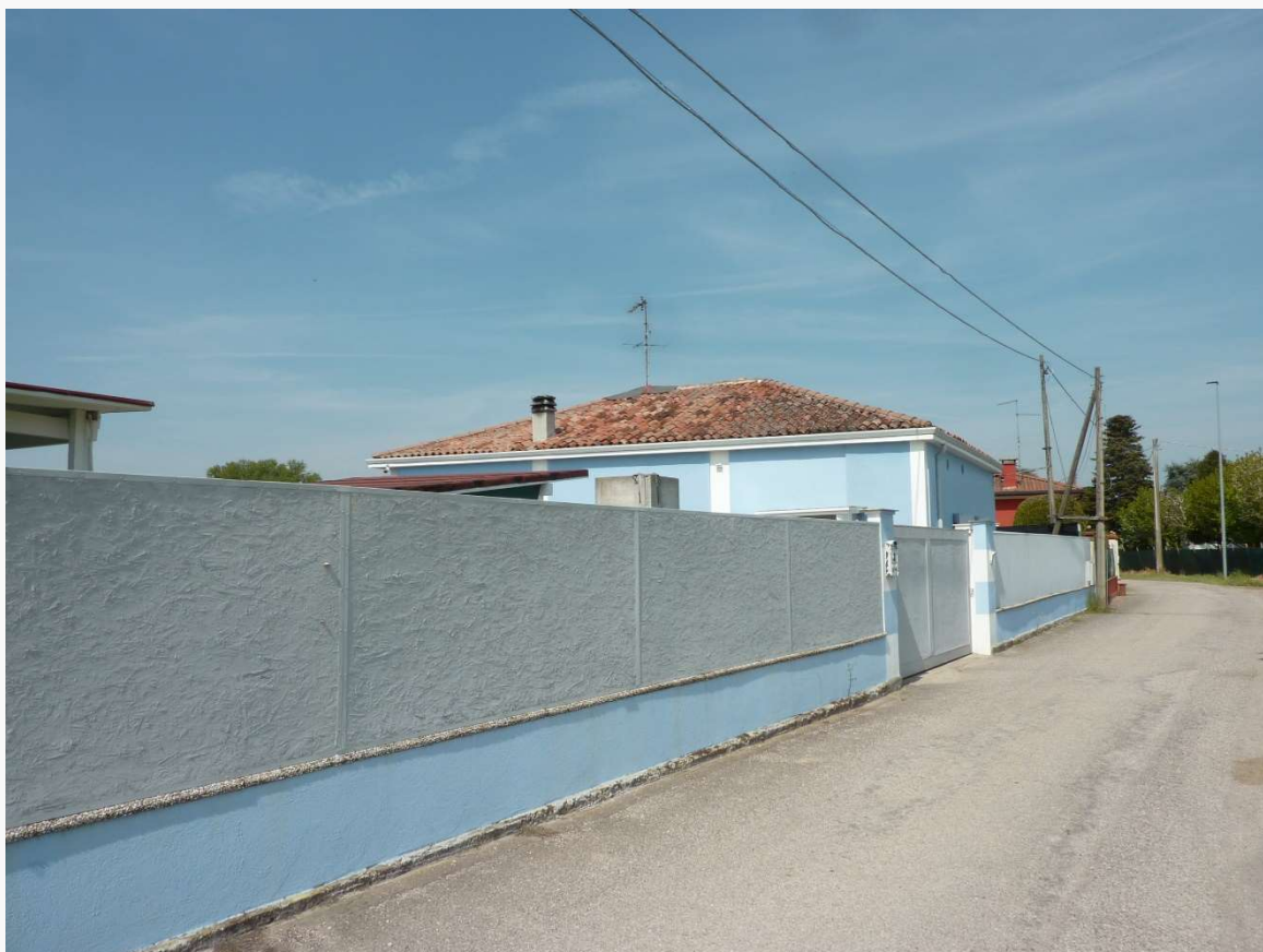
FOTO 4 _ VISTA ANGOLARE DEL COMPLESSO IMMOBILIARE DA VIA CODALUNGA – PROSPETTI SUD ED EST