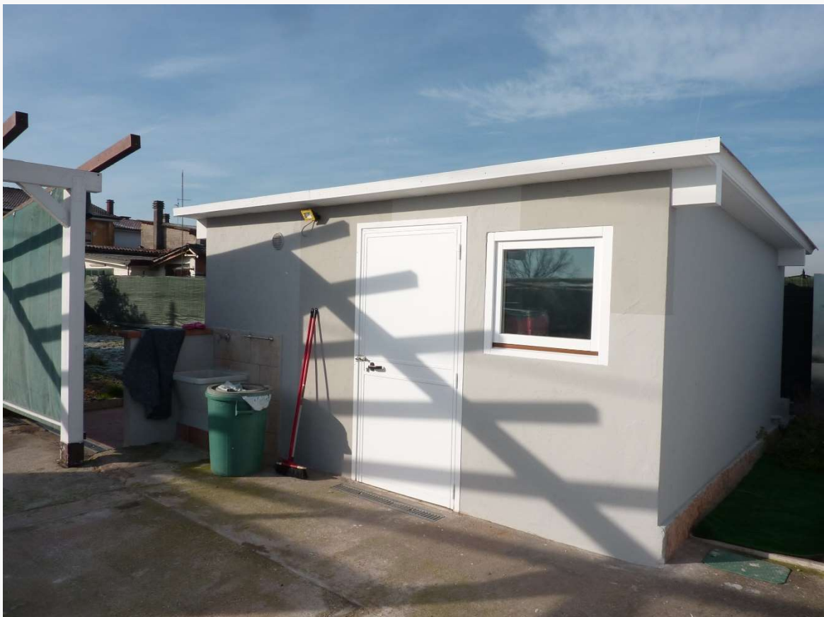
FOTO 16 _ VISTA DELL'AUTORIMESSA SUB 2 DALLA CORTE PERTINENZIALE