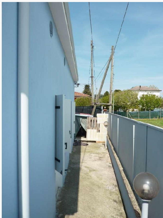
FOTO 10 _ VISTA LATERALE DEL FABBRICATO SUB 1 DALLA CORTE PERTINENZIALE – PROSPETTO EST