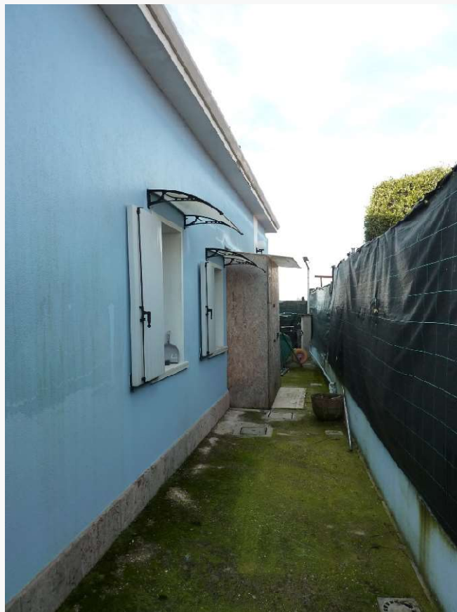
FOTO 9 _ VISTA LATERALE DEL FABBRICATO SUB 1 DALLA CORTE PERTINENZIALE – PROSPETTO NORD