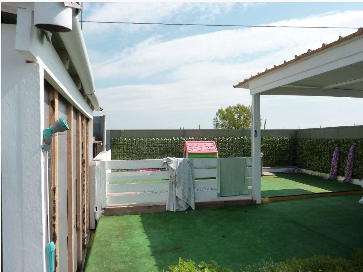
FOTO 18 _ VISTA DELLA CORTE PERTINENZIALE