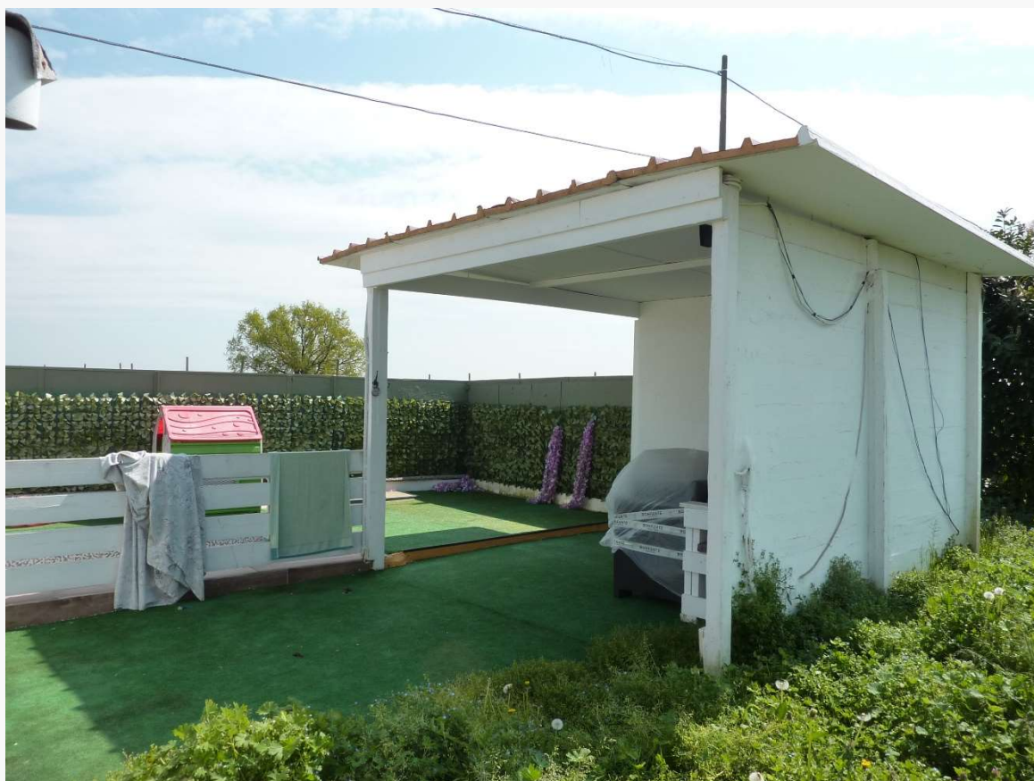
FOTO 13 _ VISTA DELLA CORTE PERTINENZIALE