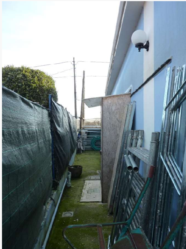
FOTO 11 _ VISTA LATERALE DEL FABBRICATO SUB 1 DALLA CORTE PERTINENZIALE – PROSPETTO NORD