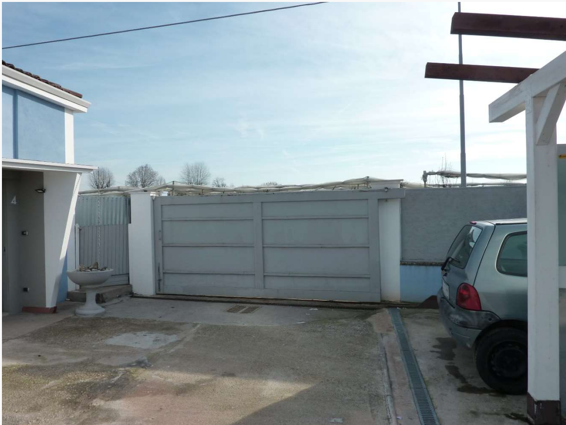
FOTO 15 _ VISTA DELL'INGRESSO CARRABILE ALLA CORTE PERTINENZIALE