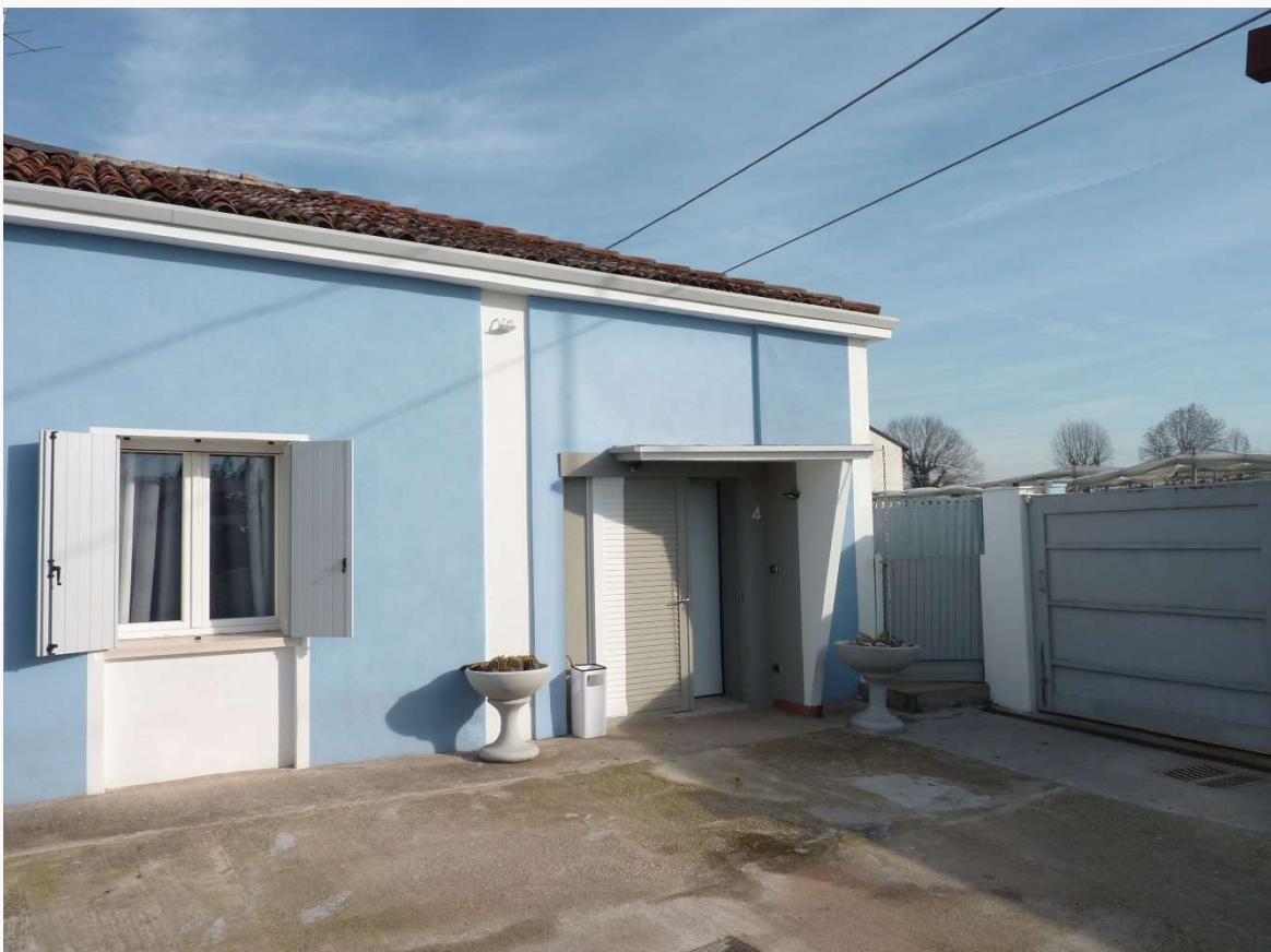
FOTO 6 _ VISTA DEL PROSPETTO PRINCIPALE DEL FABBRICATO SUB 1 – PROSPETTO SUD