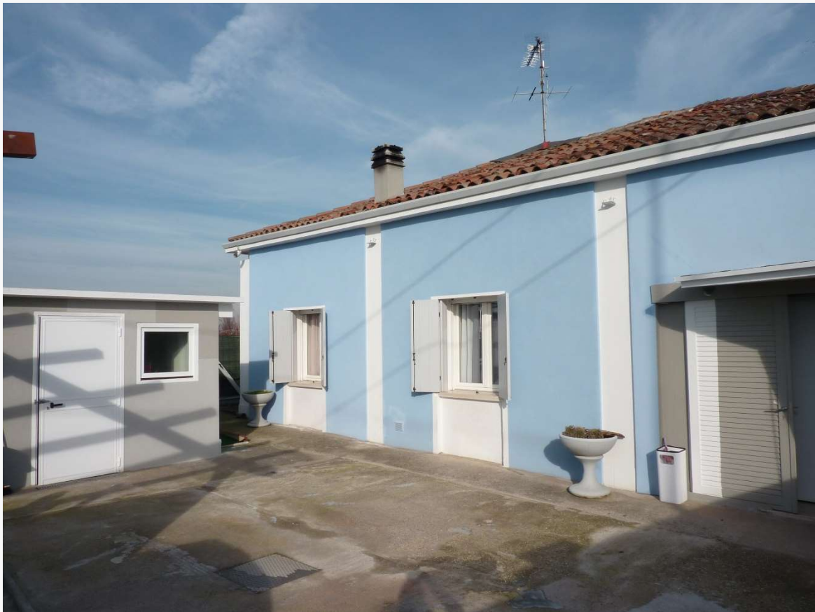
FOTO 7 _ VISTA DEL PROSPETTO PRINCIPALE DEL FABBRICATO SUB 1 – PROSPETTO SUD E VISTA DELL'AUTORIMESSA