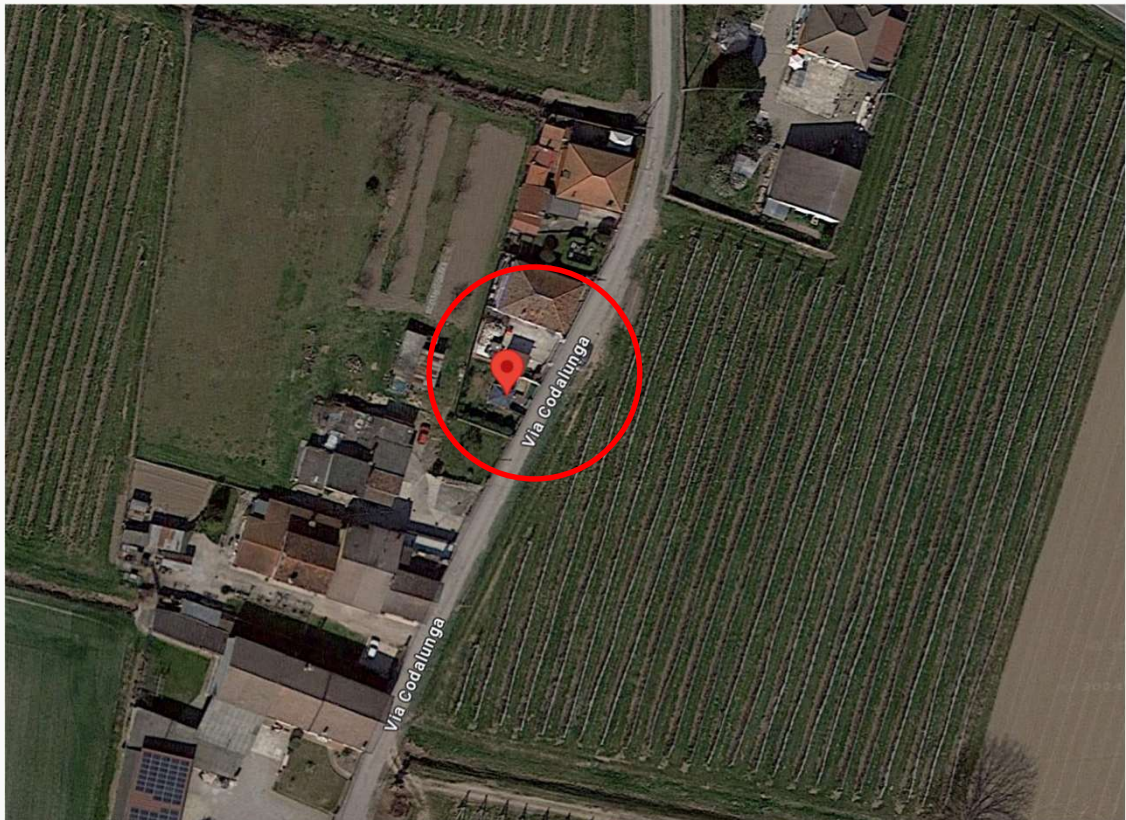
FOTO 2 _ PARTICOLARE VISTA AEREA