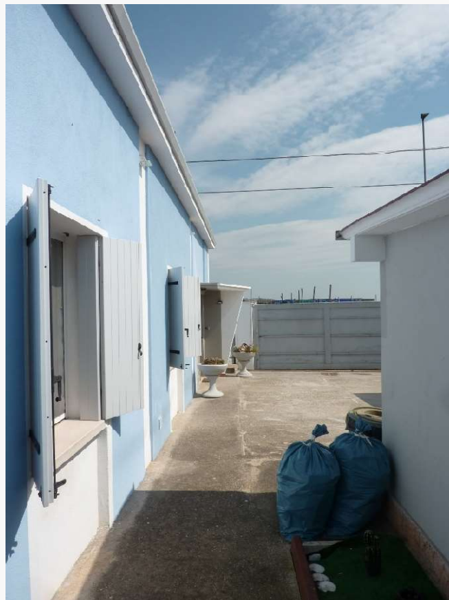
FOTO 8 _ VISTA LATERALE DELL'AUTORIMESSA SUB 2