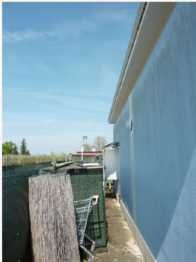
FOTO 12 _ VISTA LATERALE DEL FABBRICATO SUB 1 DALLA CORTE PERTINENZIALE – PROSPETTO OVEST