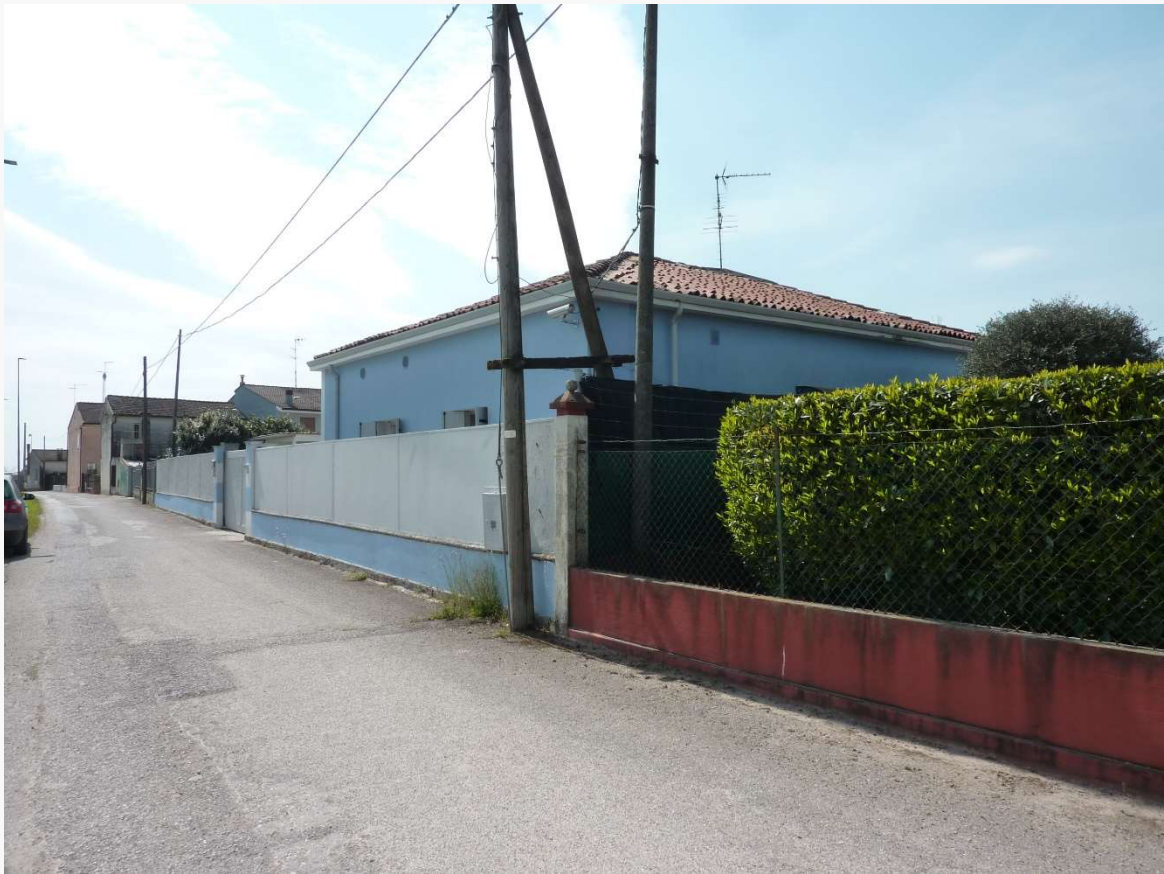
FOTO 5 _ VISTA ANGOLARE DEL COMPLESSO IMMOBILIARE DA VIA CODALUNGA – PROSPETTI NORD ED EST